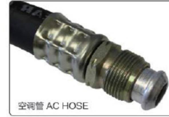
انكروان AC HOSE