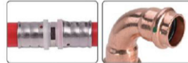
塑料管 PEX pipe