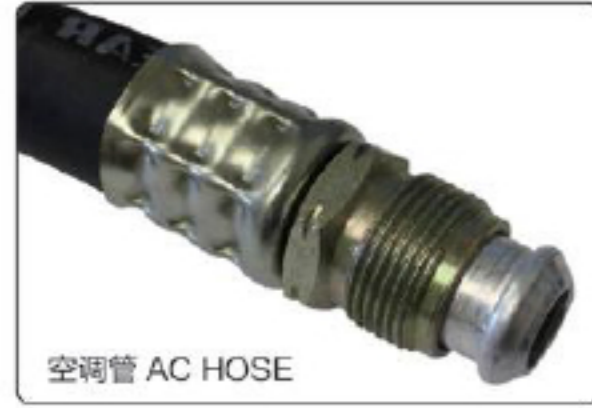
انكروان AC HOSE