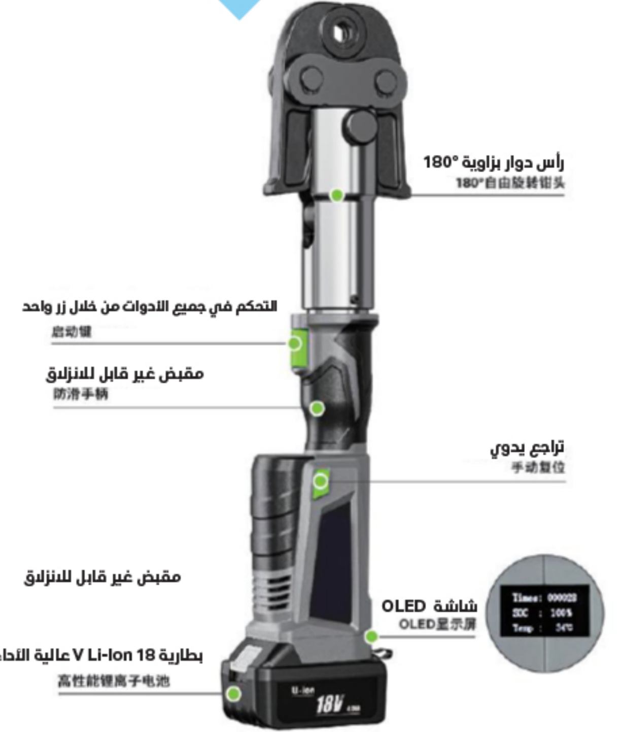
● أنبوب من الفولاذ المقاوم للصدأ: 121'