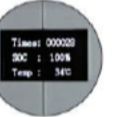
شاشة OLED شاشة OLED