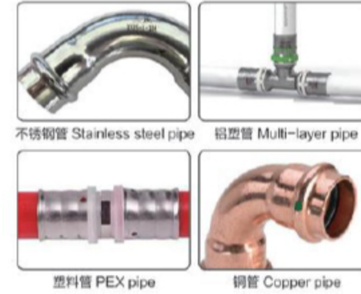
● أنبوب من الفولاذ المقاوم للصدأ: 121'