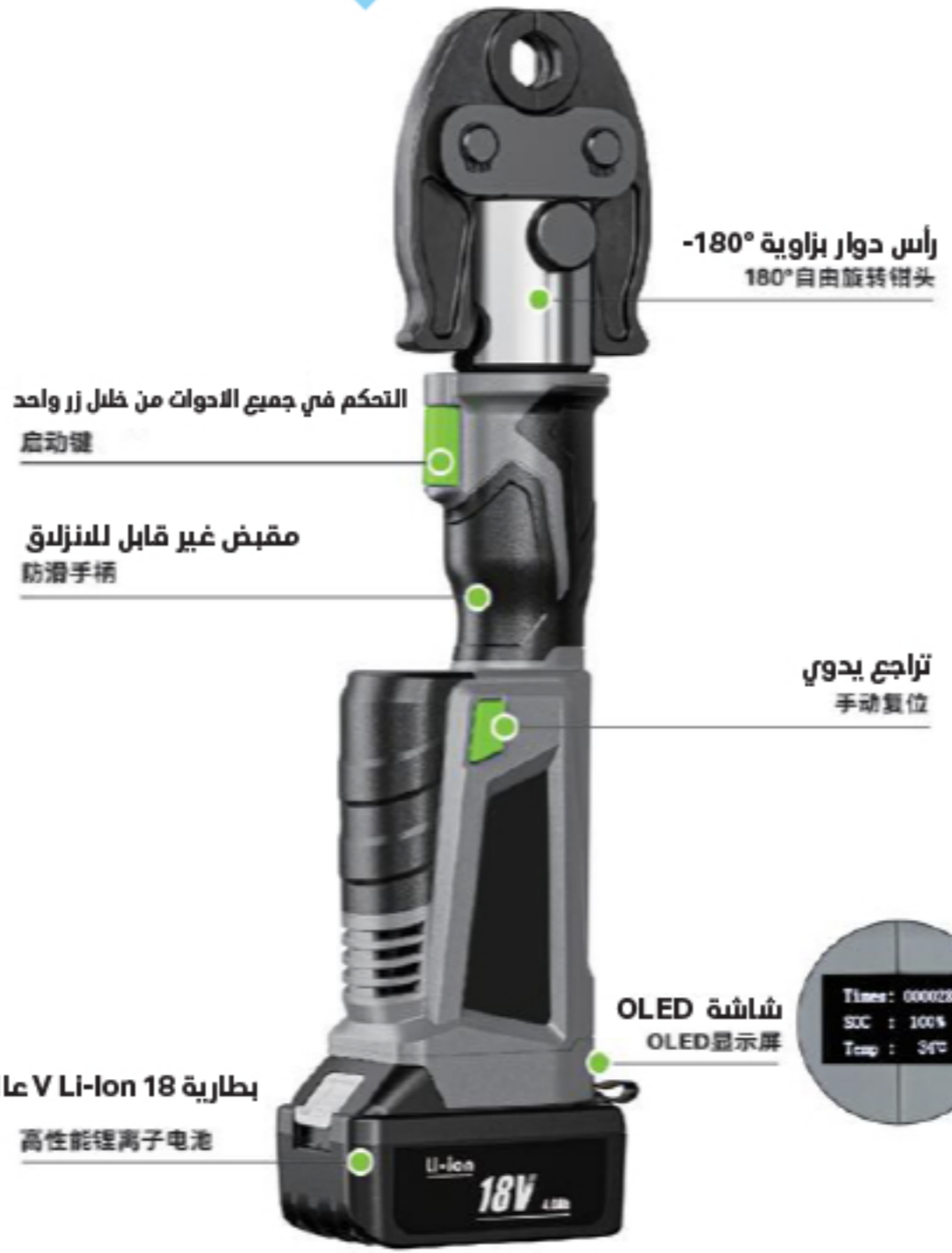
● أنبوب من الفولاذ المقاوم للصدأ: 121'