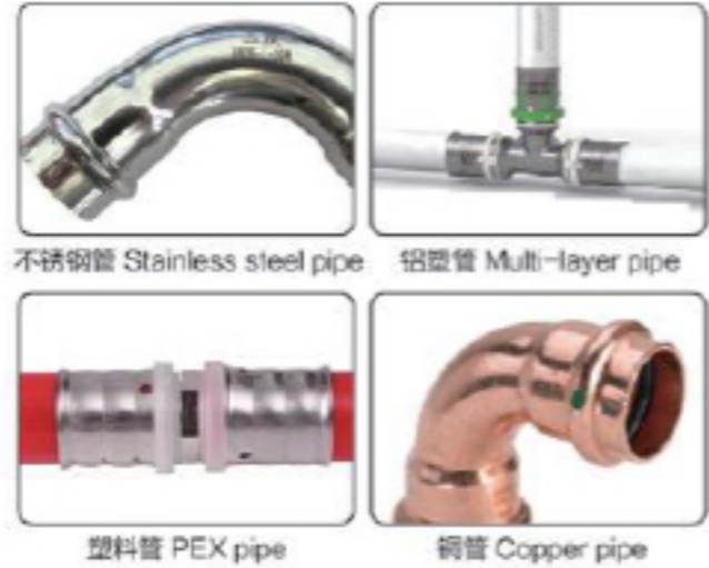
● أنبوب من الفولاذ المقاوم للصدأ: 121'