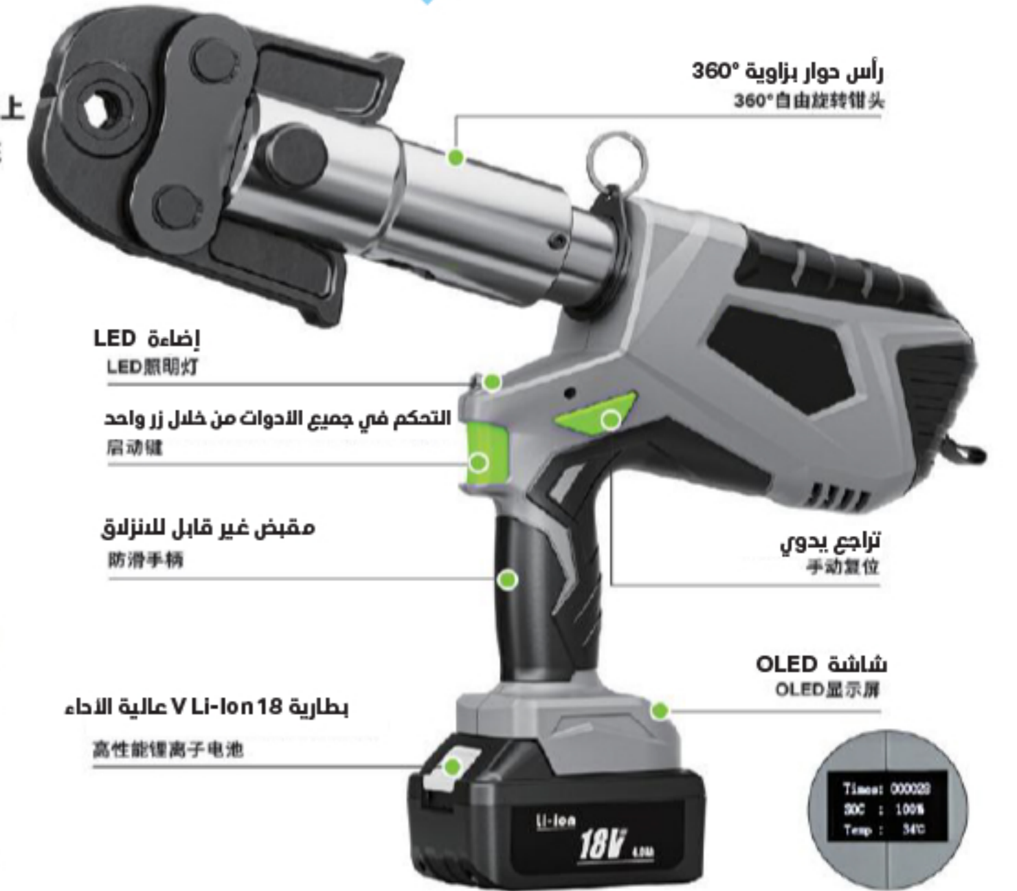
رأس حوار بزواوية 360° 360°自由旋转钳头